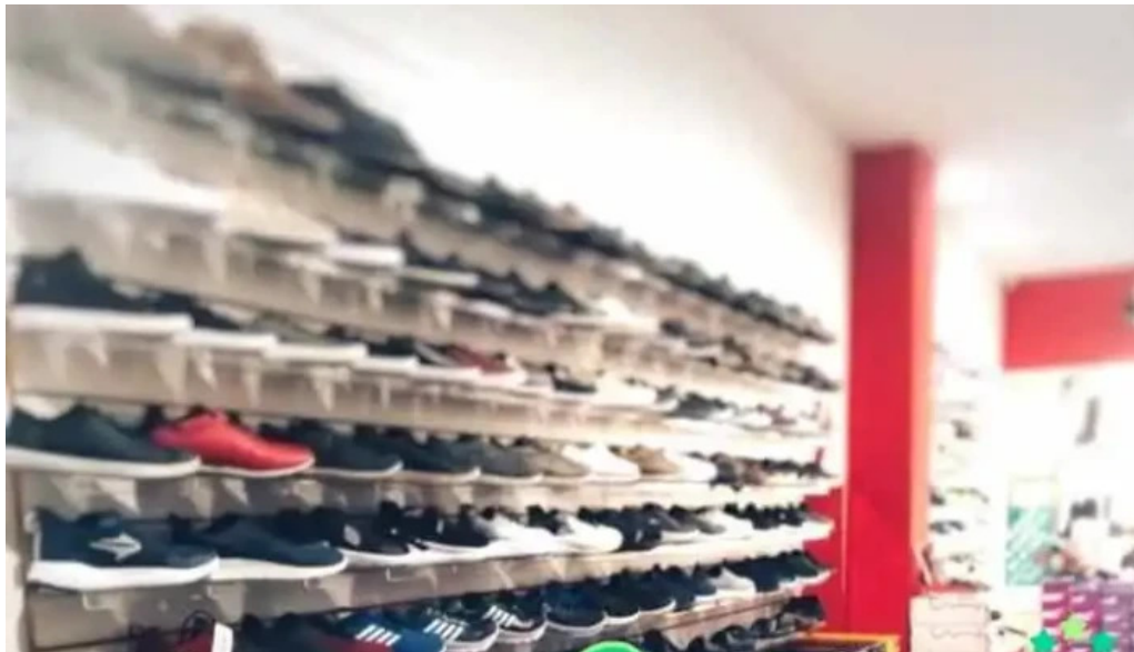
Bonita 2 interior