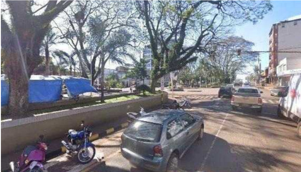
Bonita 2 fotos