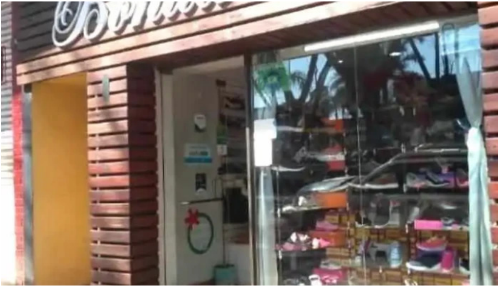
Bonita 2 obero