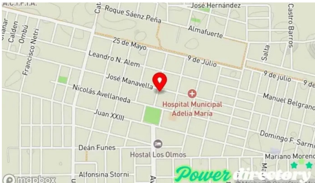
Cfi credito hogar adelia maria