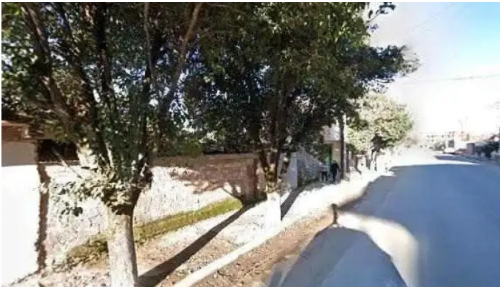
Autos motos prestamos numero