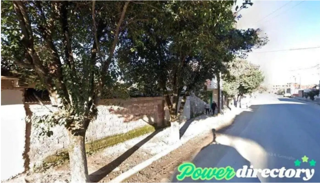
Autos motos prestamos san salvador de jujuy