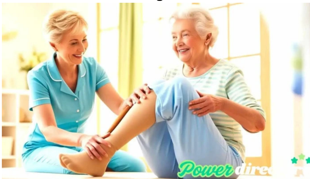
Fcs kinesiologia villa santa cruz del lago