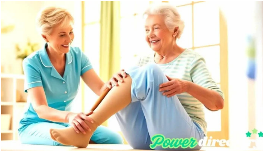
Fcs kinesiología direccion