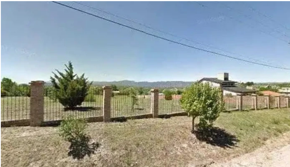
Fcs kinesiologia direcciondeg