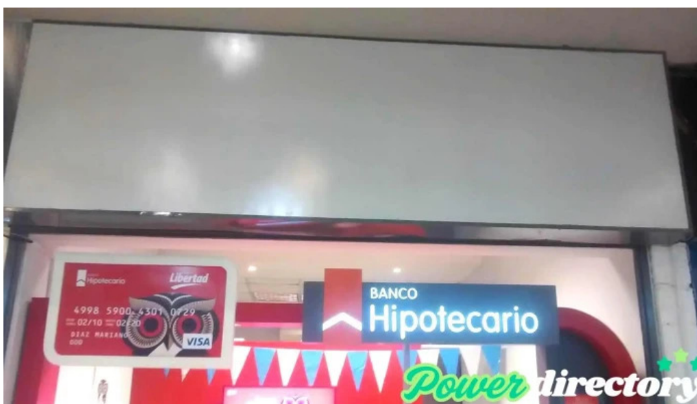
Banco hipotecario libertad catalogo