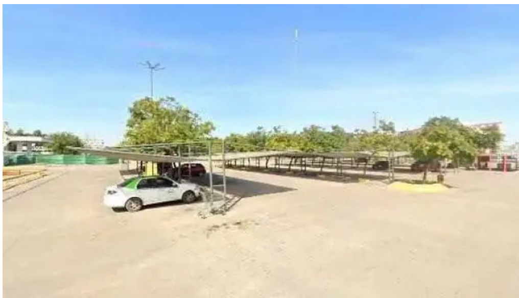
Banco hipotecario libertad catalogodeg