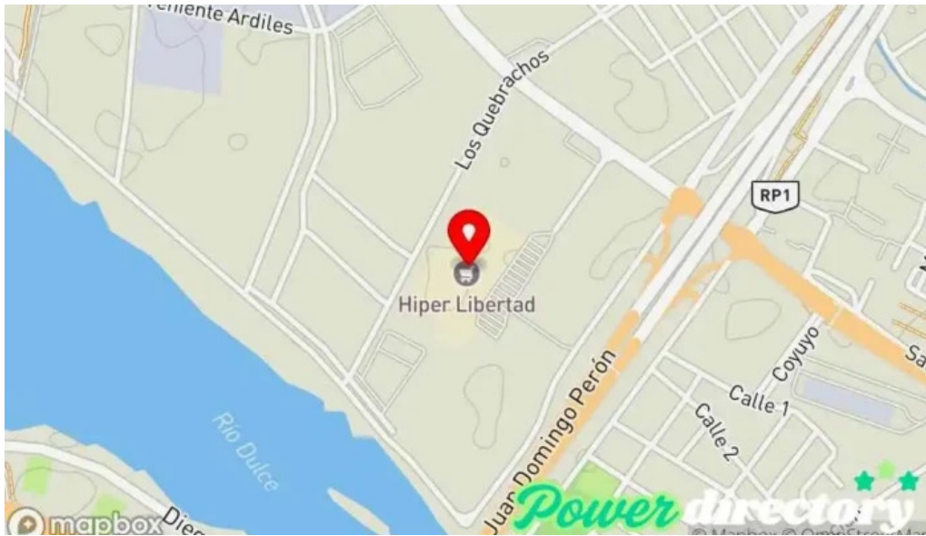
Banco hipotecario libertad mapa