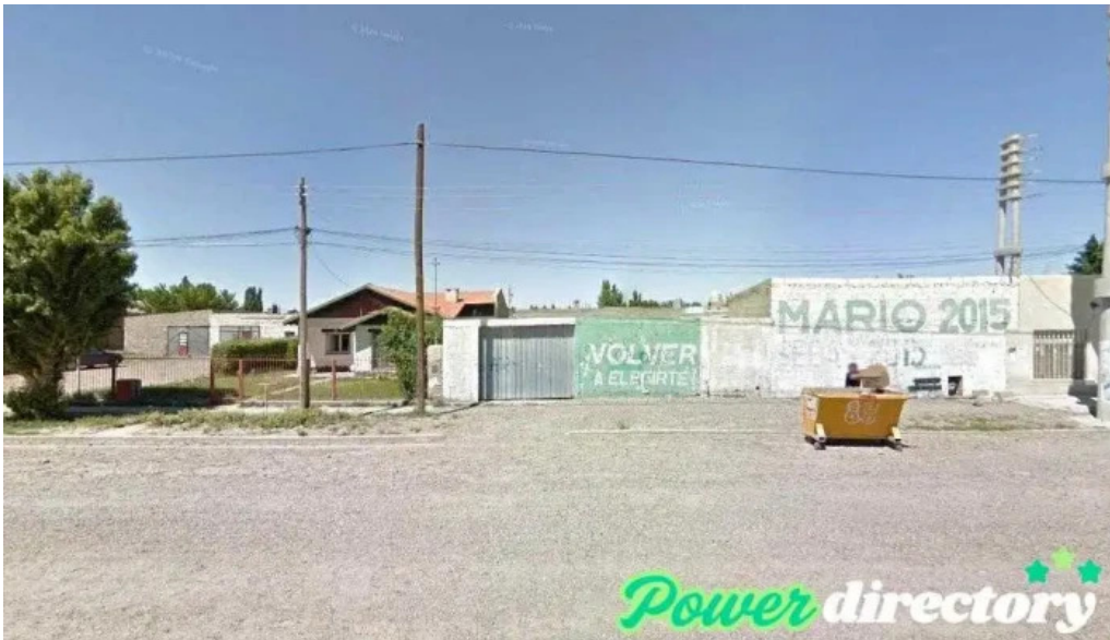
Western union pago facil agente sarmiento