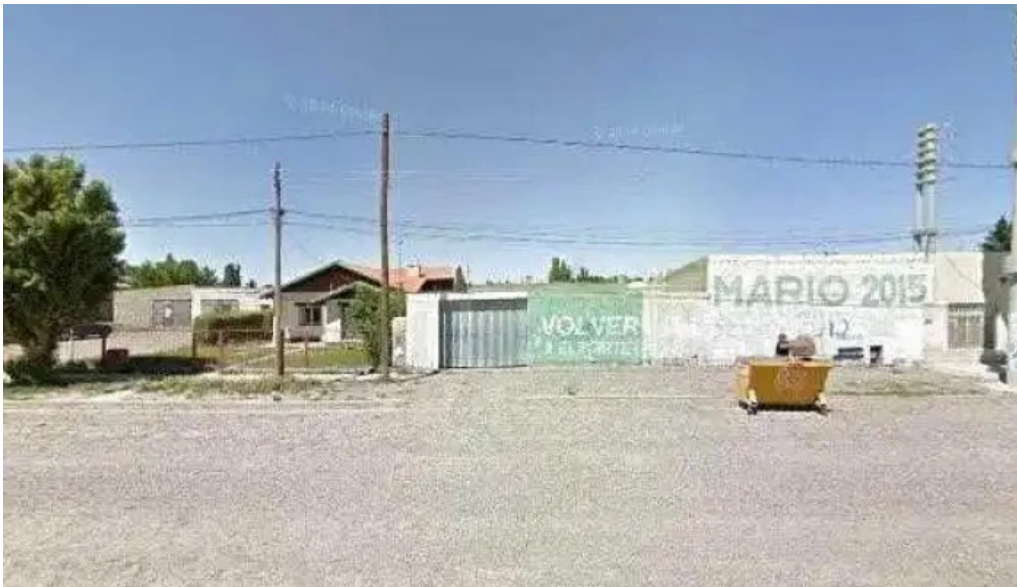
Western union pago facil agente videos