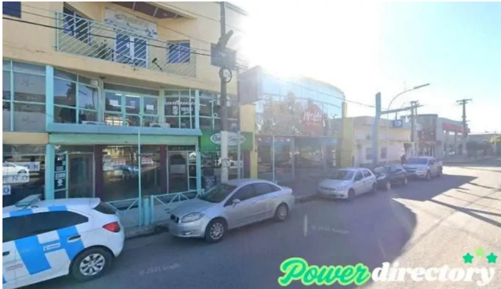
Western union pago facil agente monte cristo