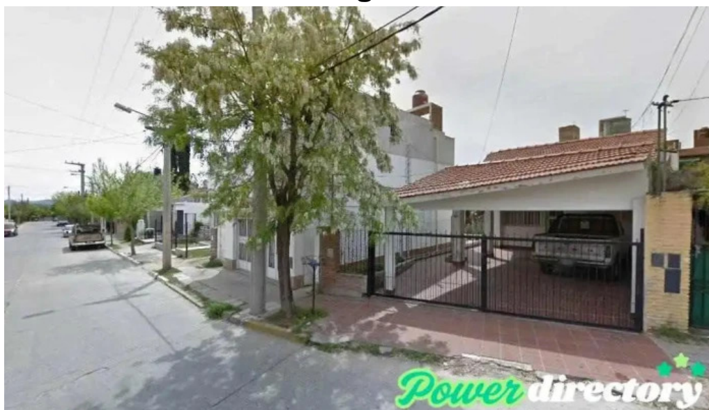
Western union pago facil agente mina clavero