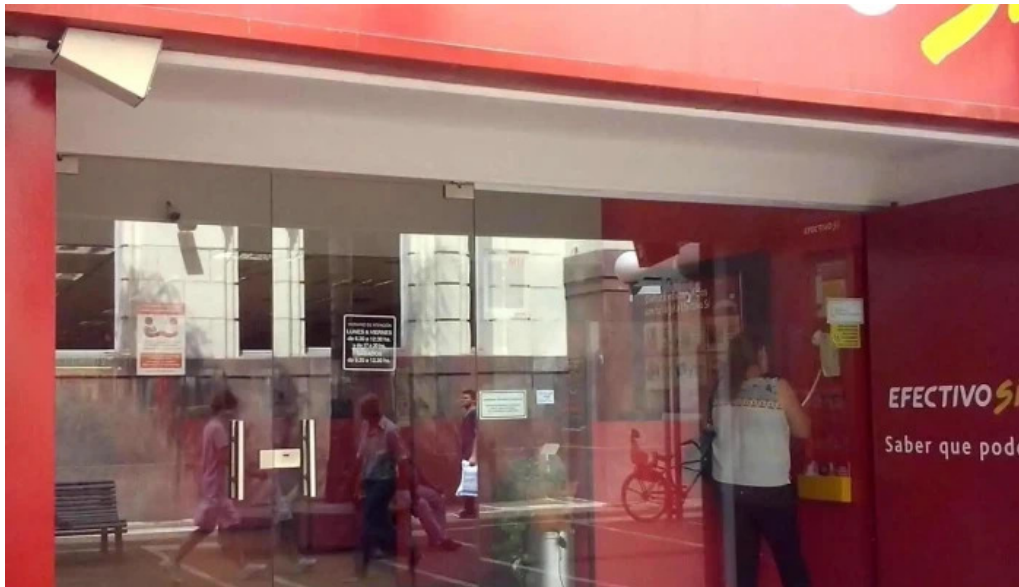
Efectivo si santa fe exterior