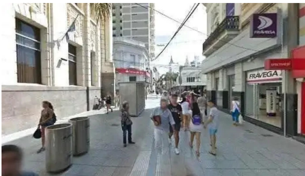
Efectivo si santa fe descuentosdeg