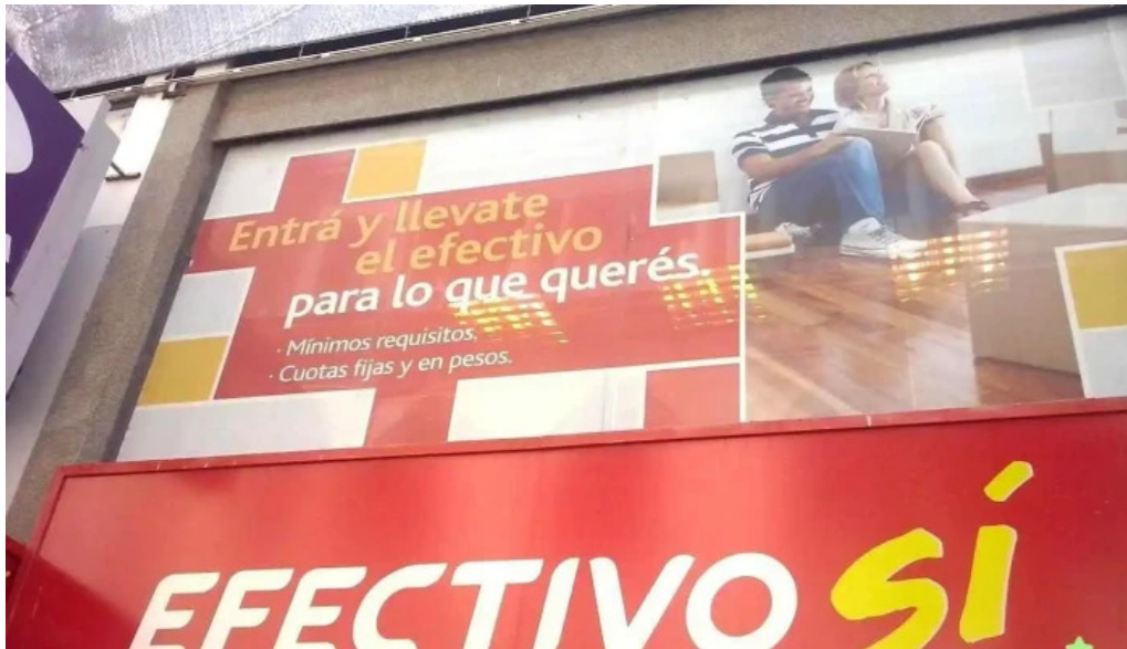
Efectivo si santa fe fsb