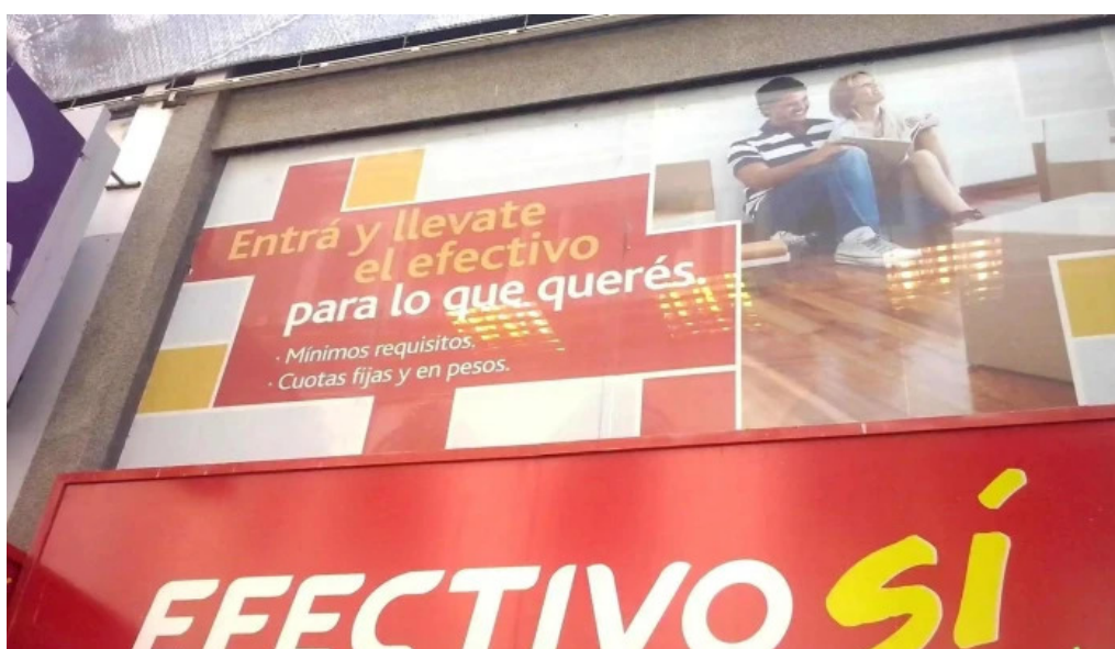
Efectivo si santa fe descuentos