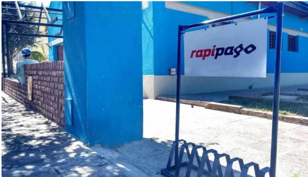
Rapipago chos malal