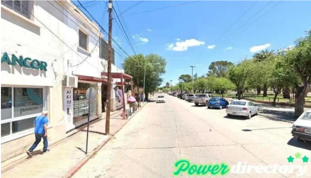
Western union pago facil agente capilla del monte