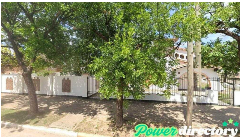
Cobro express brinkmann