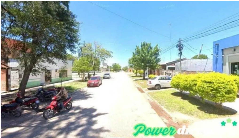
Rapipago avia terai