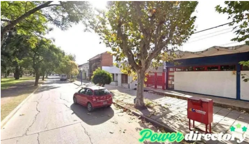
Western union arroyo seco