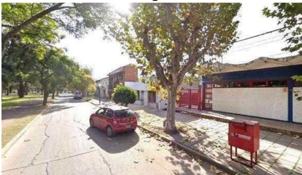
Western union ubicacion