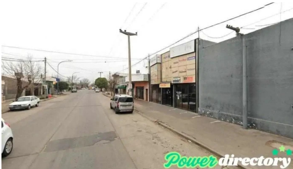
Rapipago arroyo seco