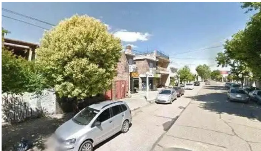
Cobro express cerca de mi