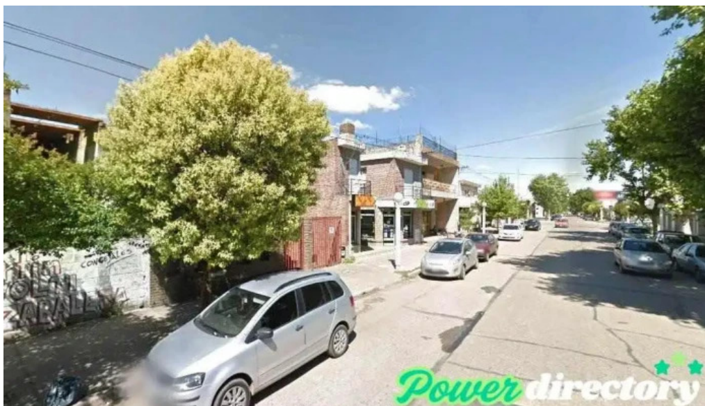
Cobro express arroyo seco