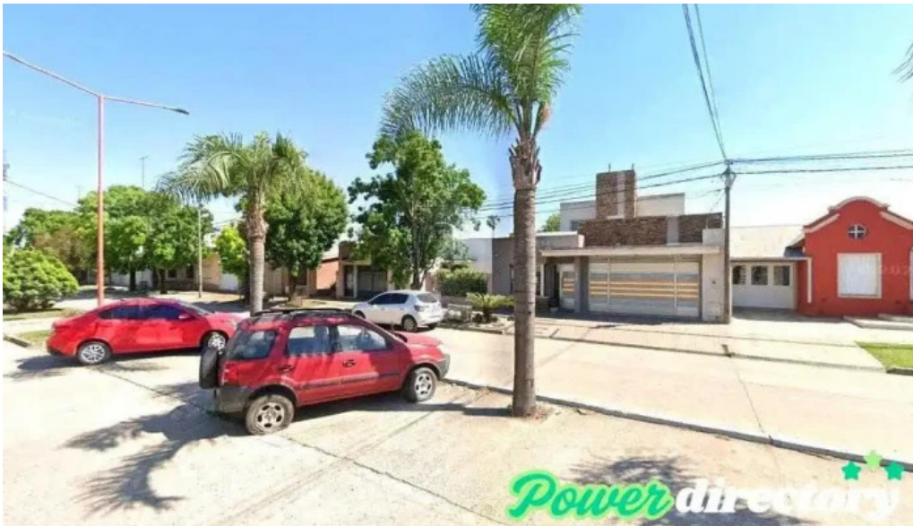
Western union armstrong