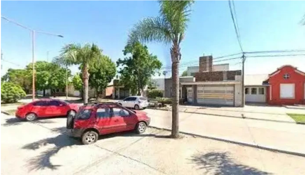
Western union donde