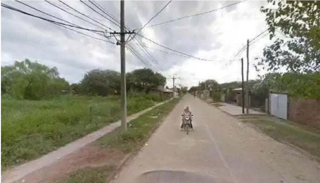
Cobro express zona