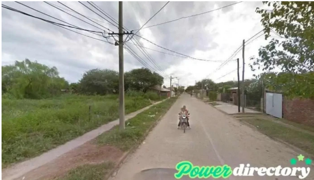
Cobro express anatuya