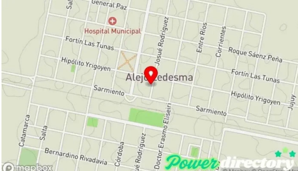
Cobro express mapa