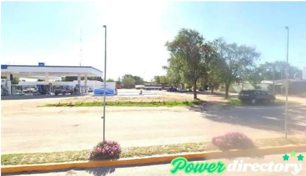
Western union achiras