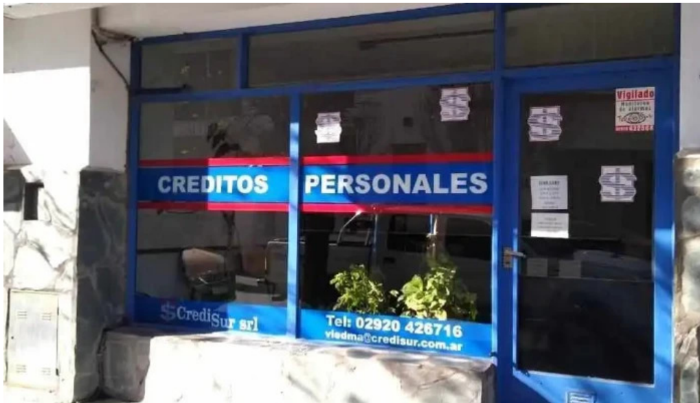
Credisur srl del propietario