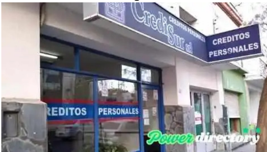
Credisur srl santa rosa