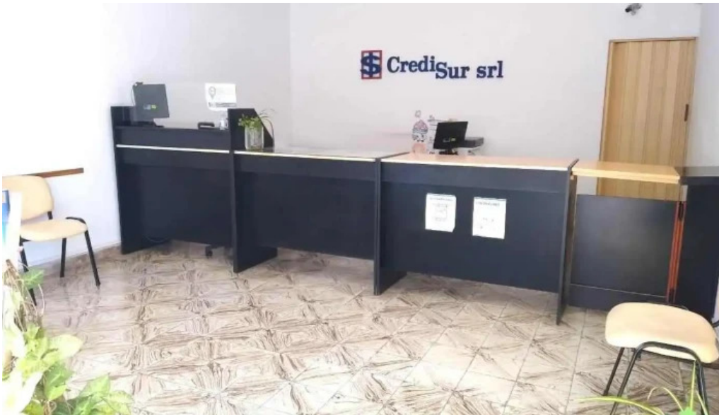
Credisur srl interior