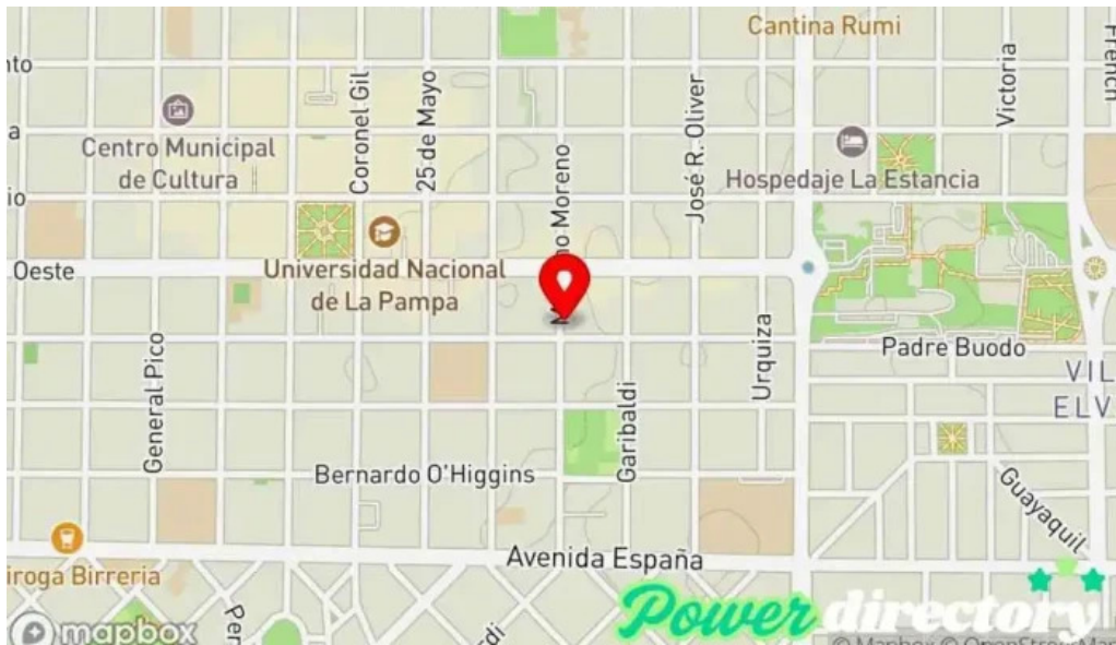
Credisur srl mapa