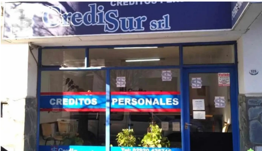
Credisur srl exterior