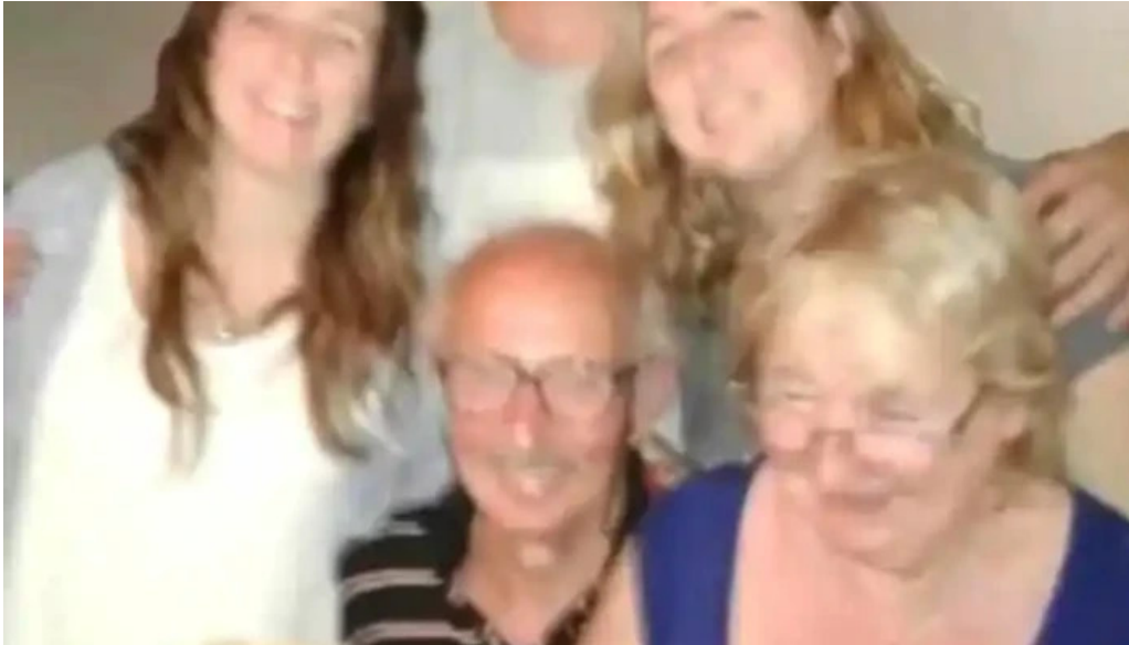
Credito argentino administracion central videos