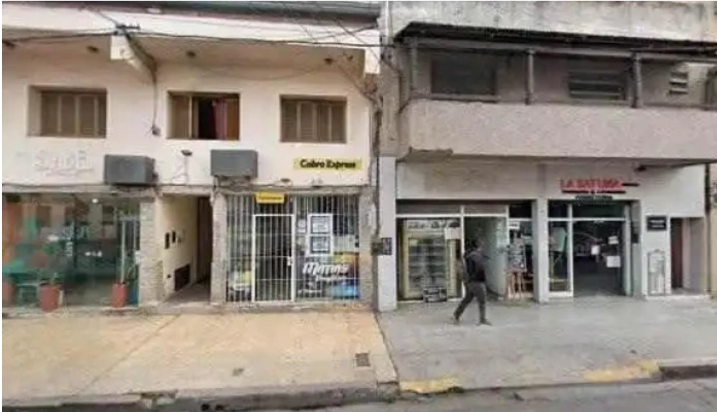
Cash cerca de mi