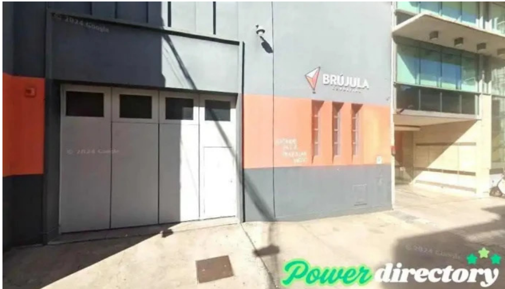
Grupo alba prestamos rosario