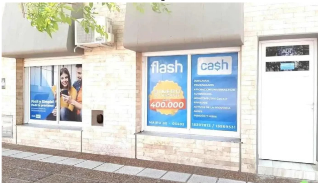
Creditos del oeste rafaela