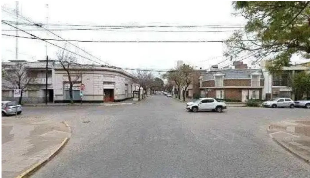
Creditos del oeste direcciondeg