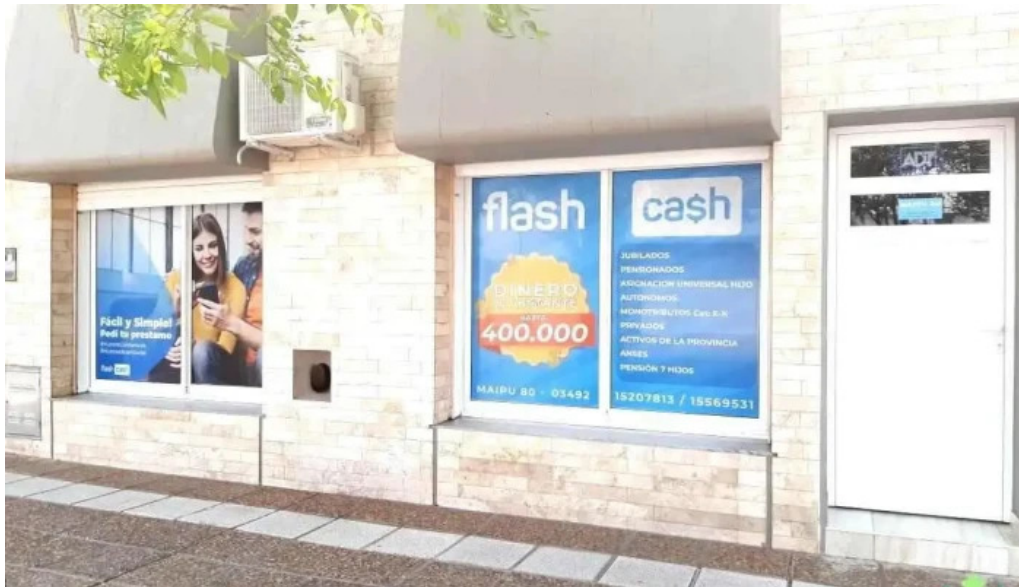
Creditos del oeste direccion