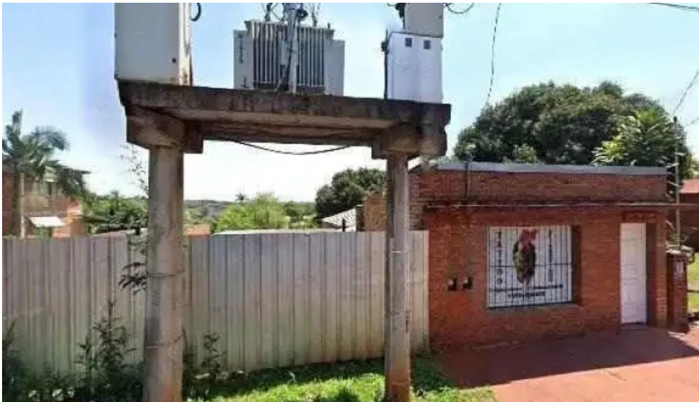
Creditos mesopotamia fotos