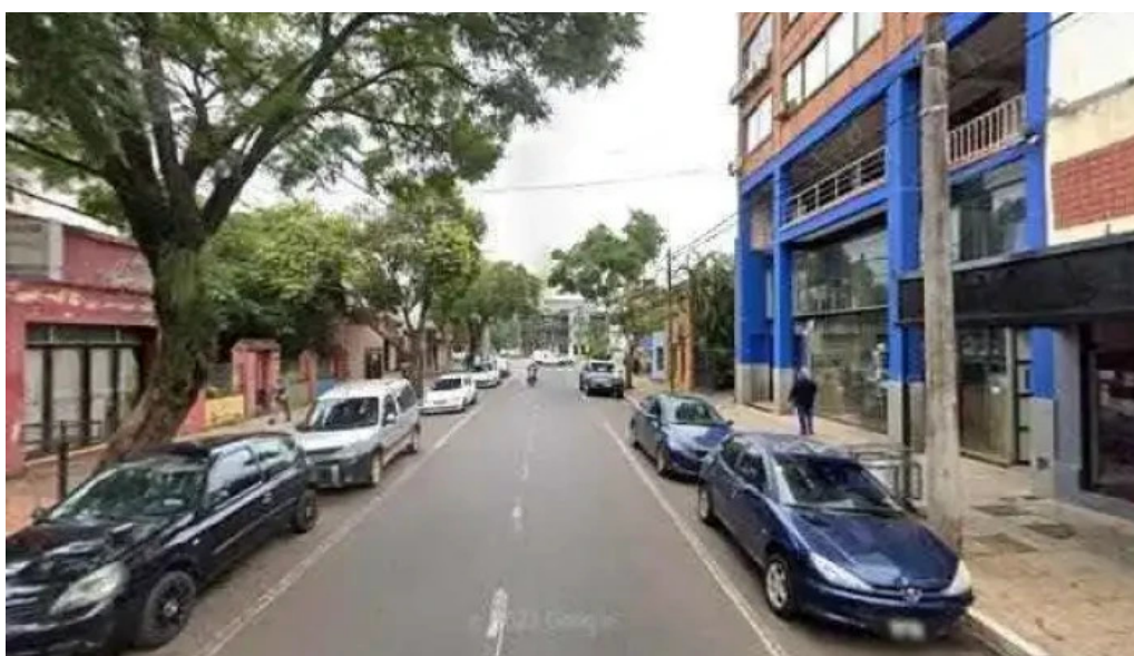
Prestamo lider catalogo