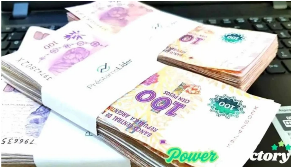
Préstamo líder posadas