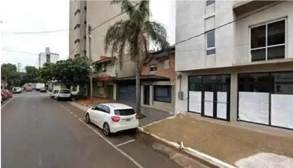
Global soluciones posadas abierto ahora