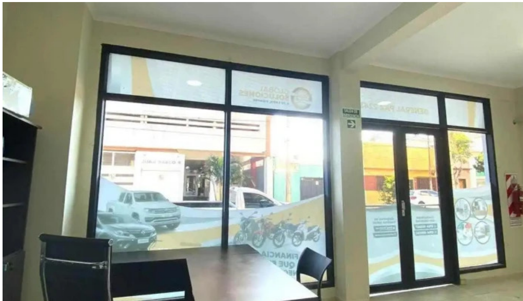
Global soluciones posadas del propietario