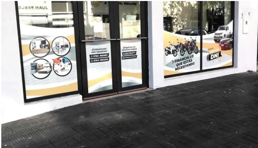
Global soluciones posadas exterior