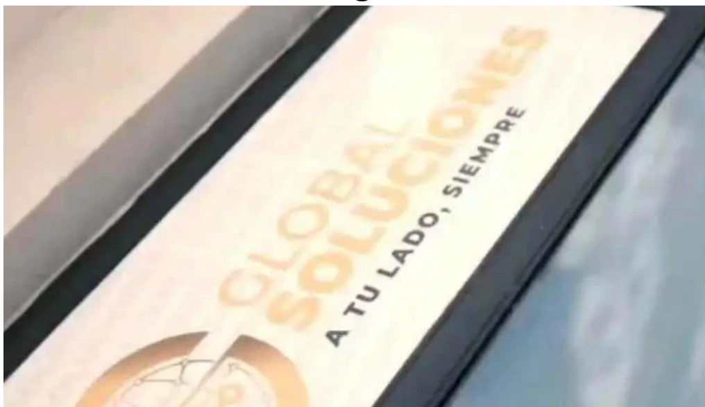
Global soluciones posadas videos