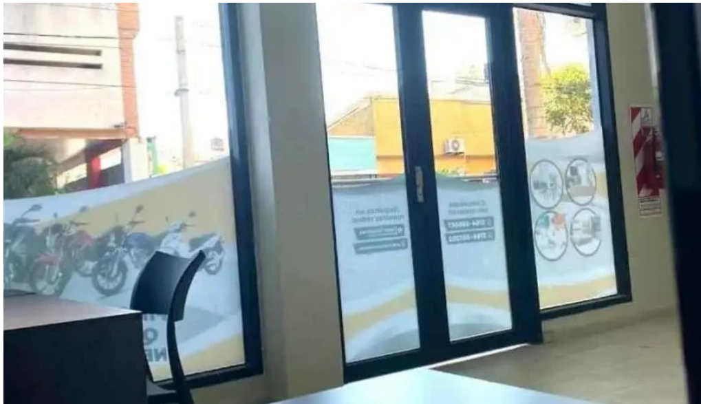
Global soluciones posadas posadas