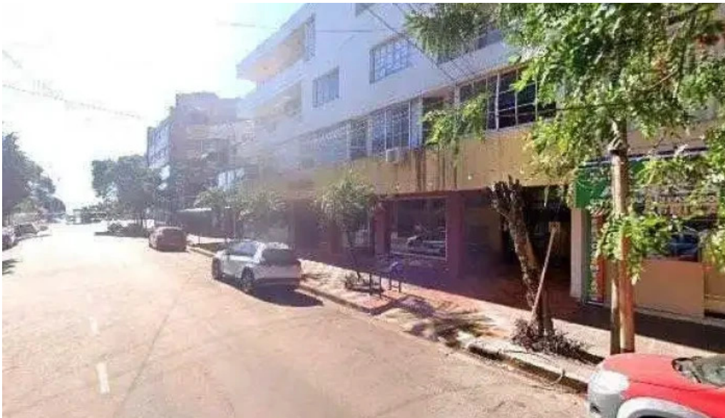
Crediser sucursal obero opiniones