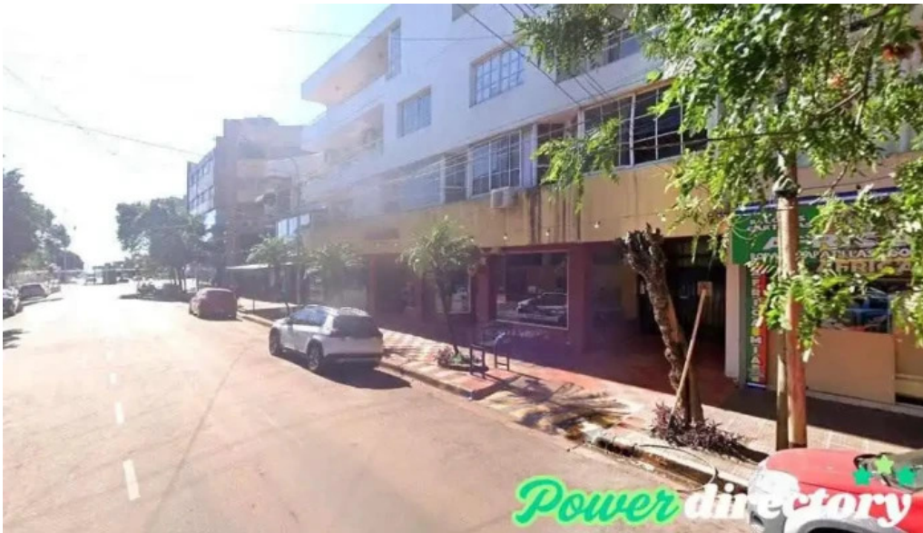
Crediser sucursal obero obero