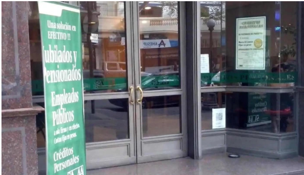
Saaa ci y financiera creditos personales videos