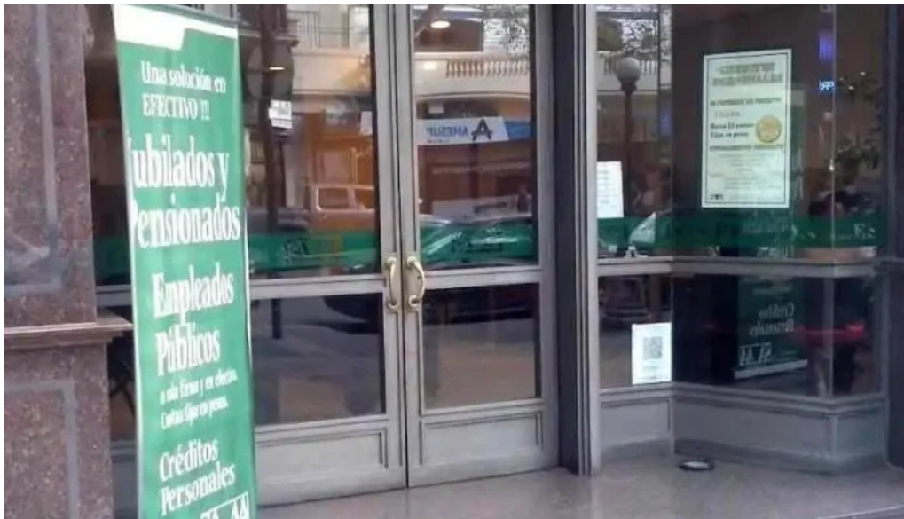
Saa c i y financiera credits personales mendoza