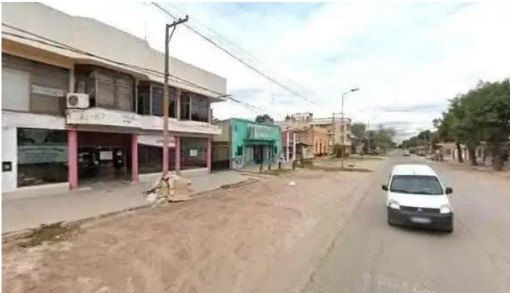
Prestamos personales crenac promocion