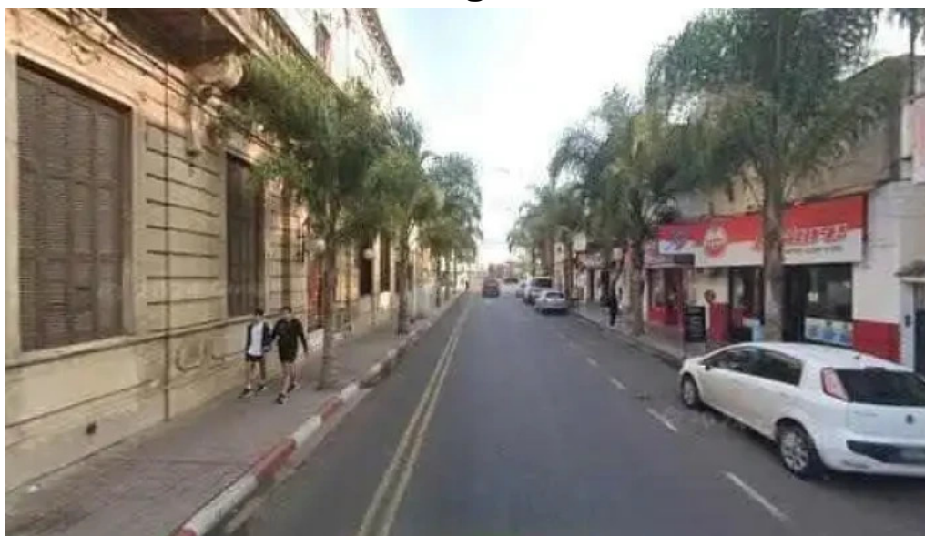
Creditos del plata sitio web