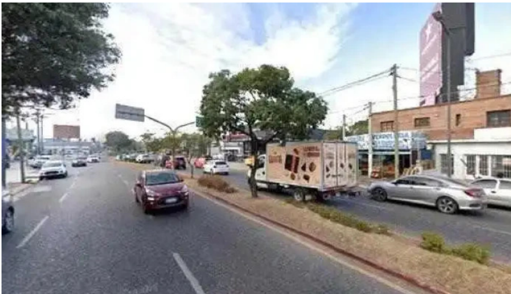
Centro financiero cba promocion