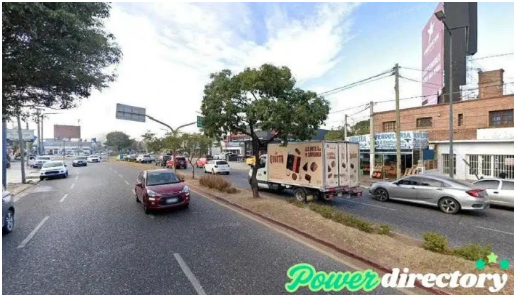
Centro financiero cba cordoba