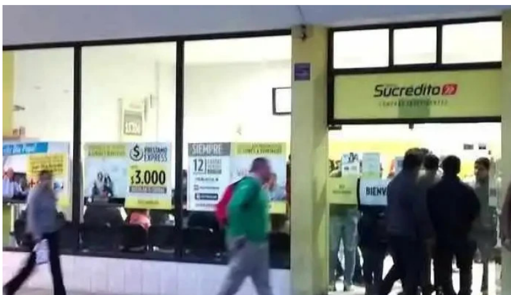
Tarjeta sucredito concepcion