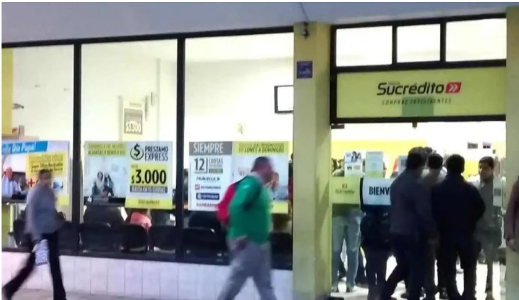
Tarjeta sucredito opiniones