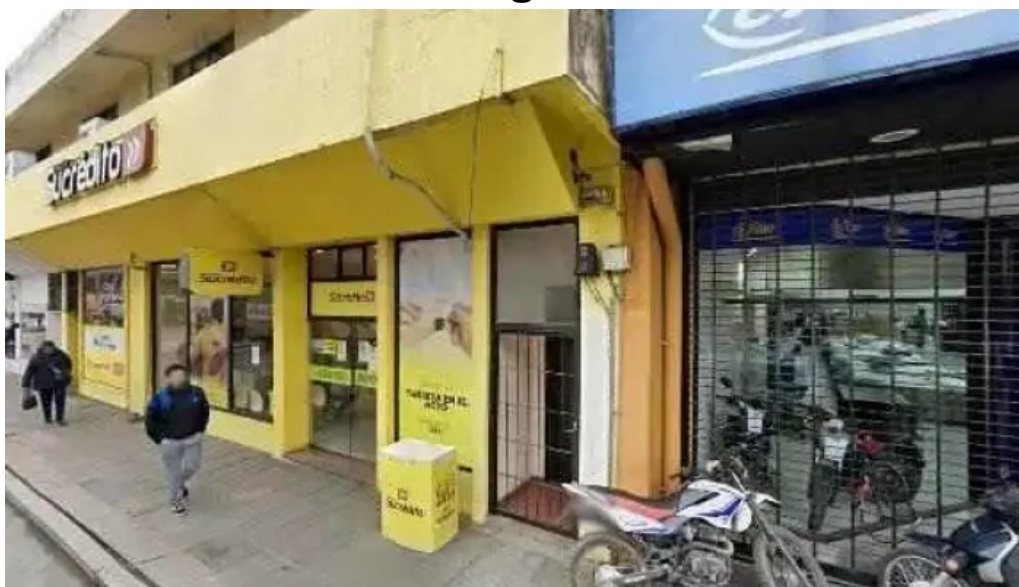
Tarjeta sucredito opinionesdeg