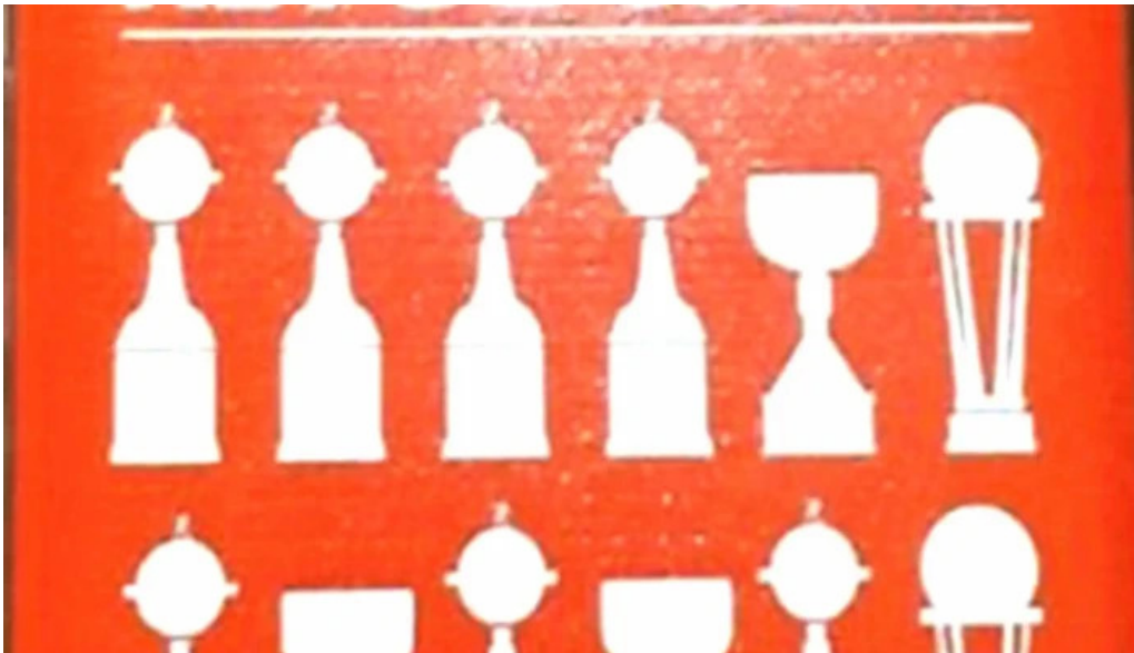
Todo credits abierto ahora