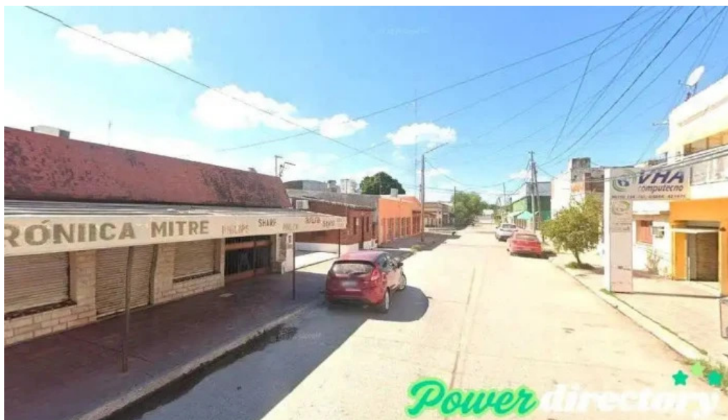
Registro automotor anatuya anatuya