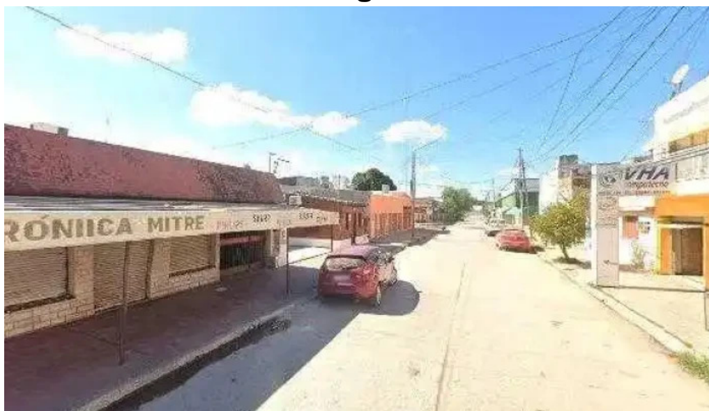
Registro automotor anatuya zona