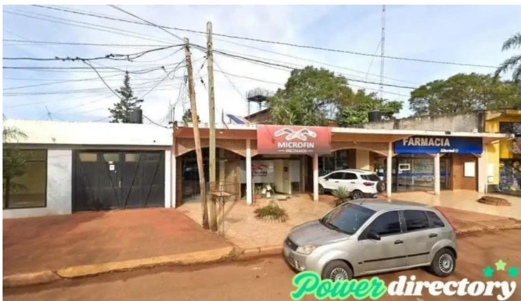
Microfin prestamos san vicente