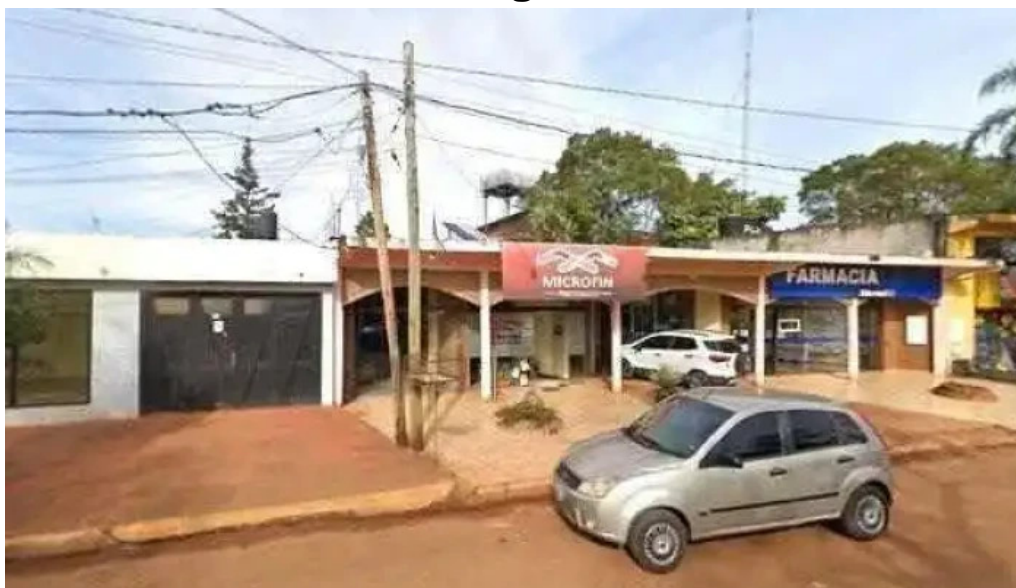
Microfin prestamos zona