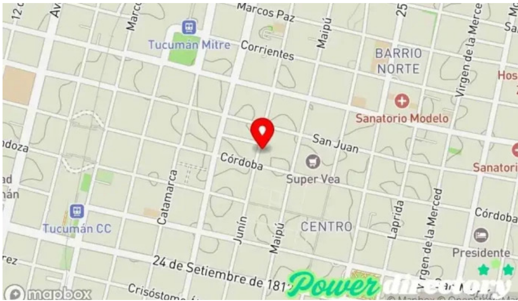
Ofrecer prestamos en efectivo mapa