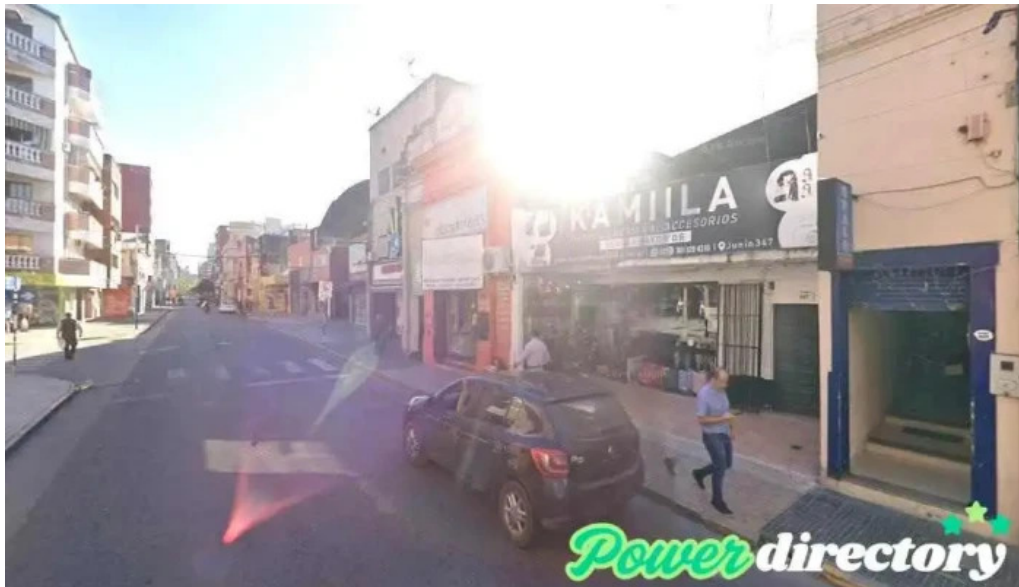
Ofrecer prestamos en efectivo san miguel de tucuman