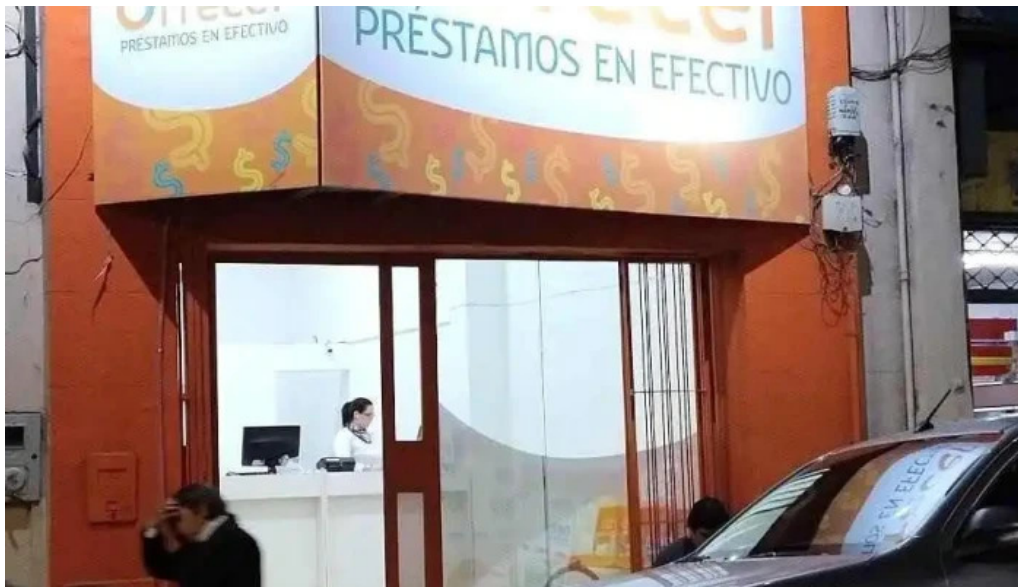
Ofrecer préstamos en efectivo del propietario