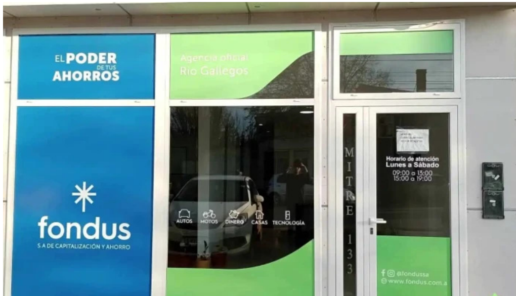
Fondus sa de capitalizacion y ahorro promocion