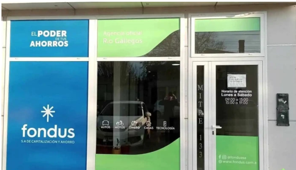
Fondus s a de capitalizacion y ahorro rio gallegos