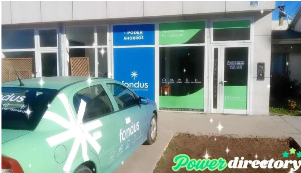
Fondus sa de capitalizacion y ahorro del propietario