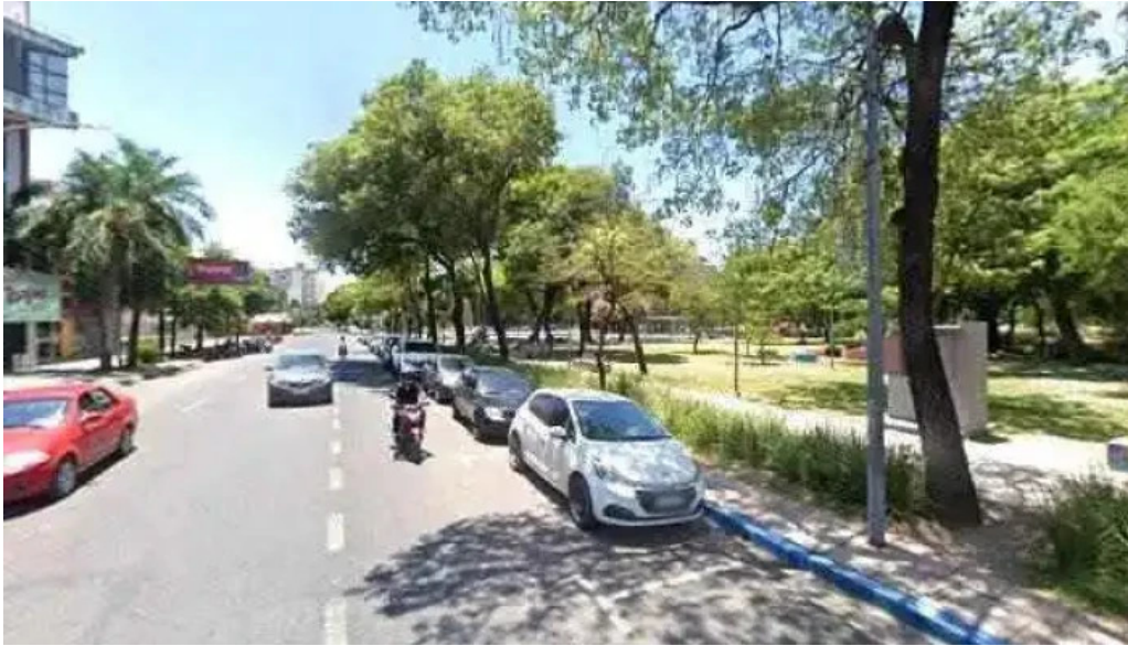
Flash money ubicacion