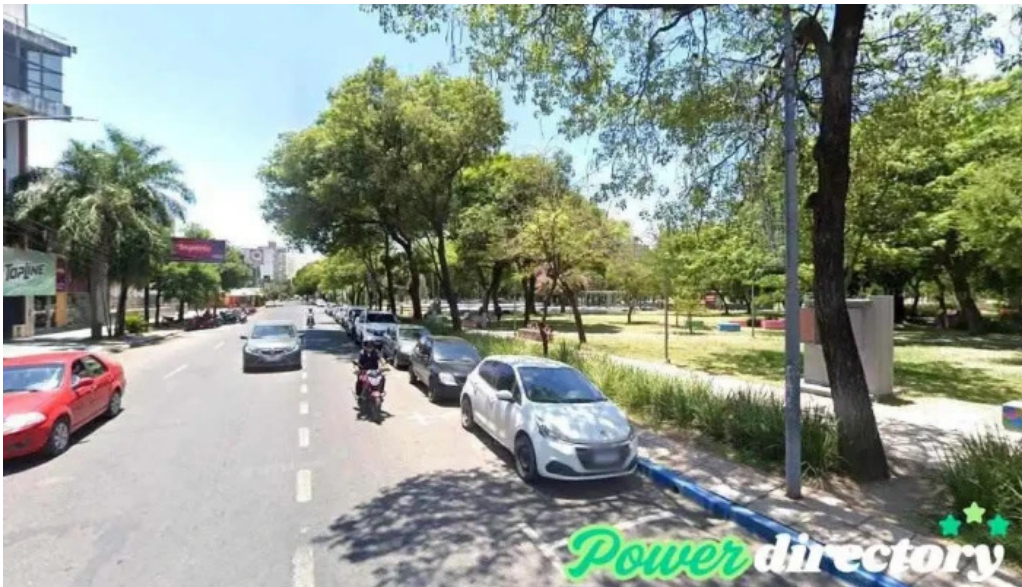
Flash money resistencia