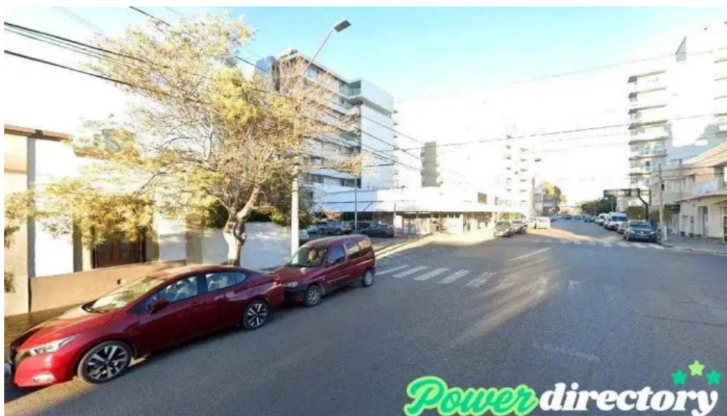
Empresur sa puerto madryn