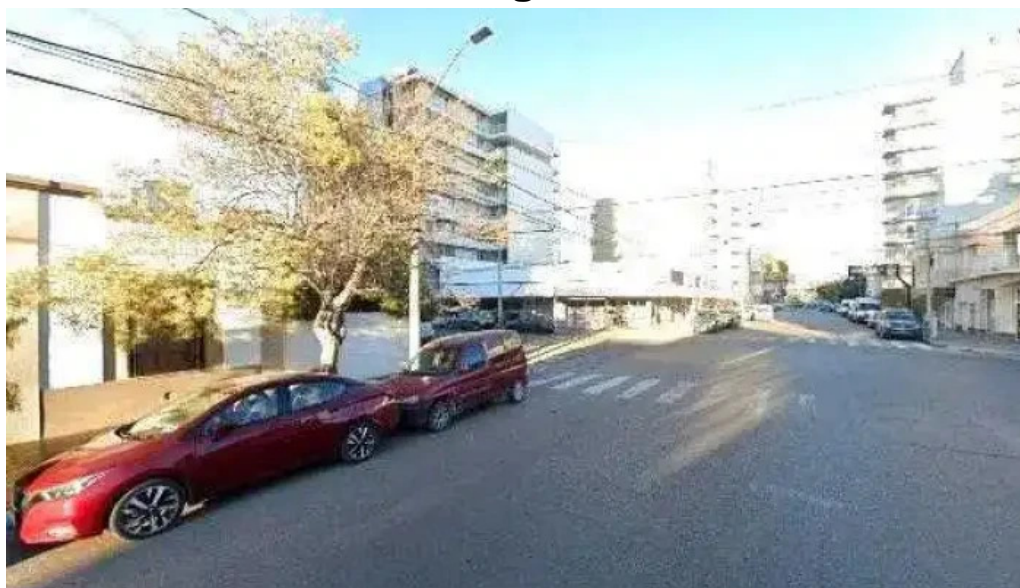
Empresur sa puntaje