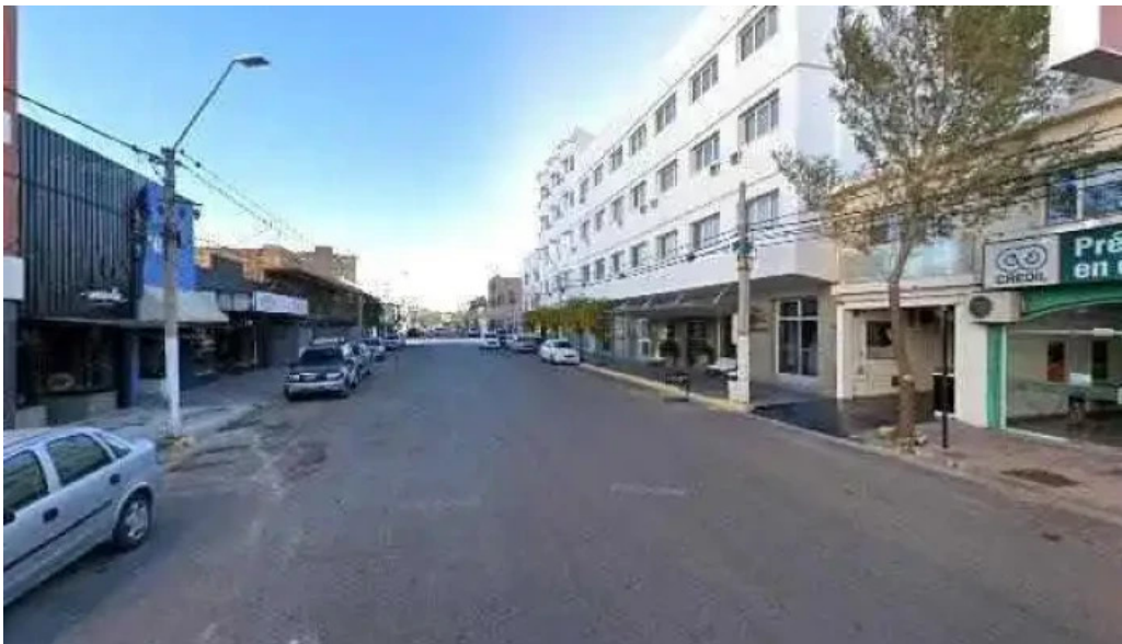
Creditos personales a sola firma solo con dni direccion