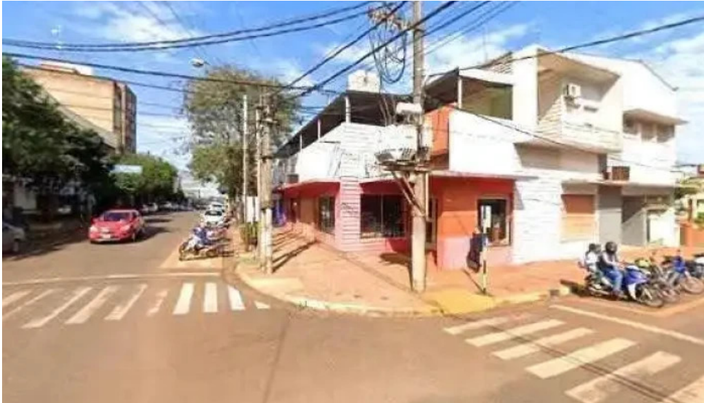
Creditos en el acto catalogo