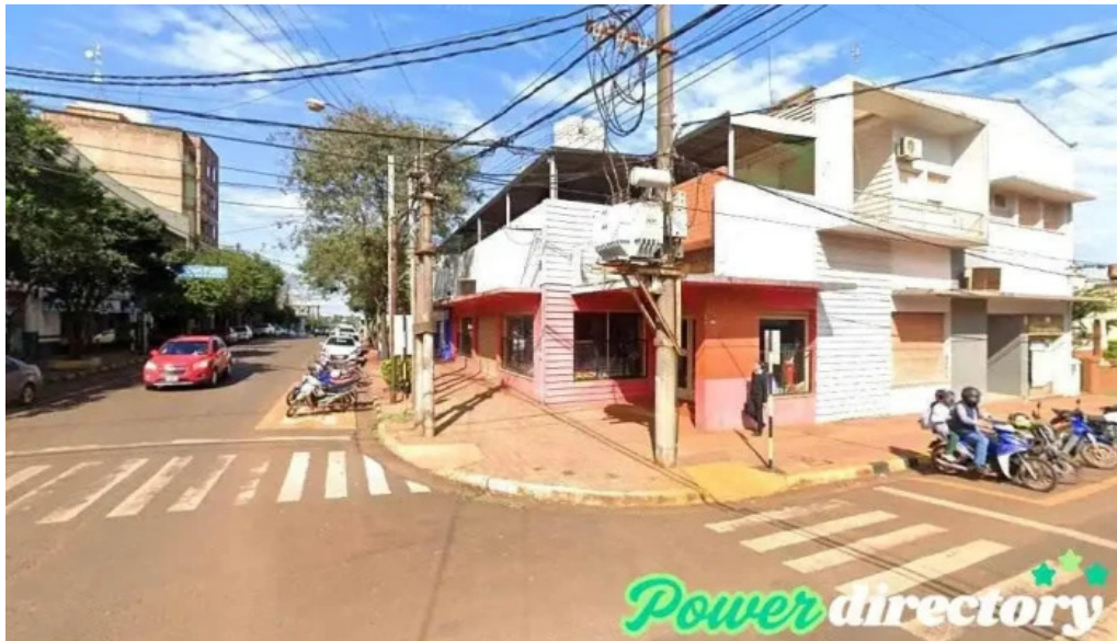
Creditos en el acto obra