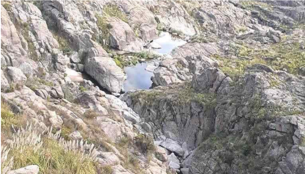
Los condores los condores