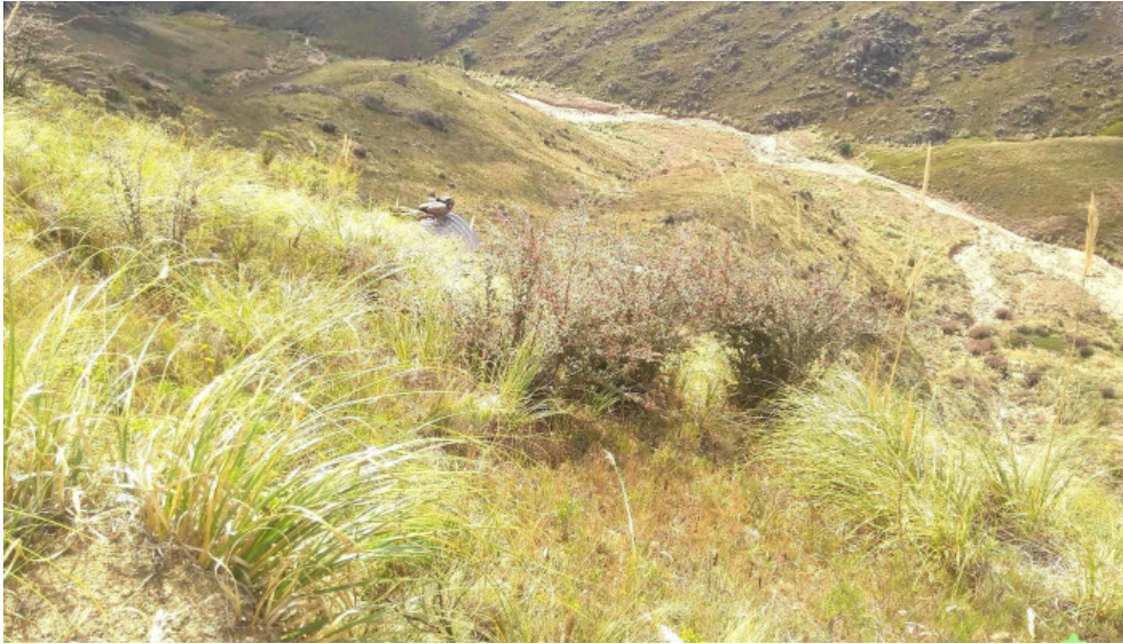
Los condores montana