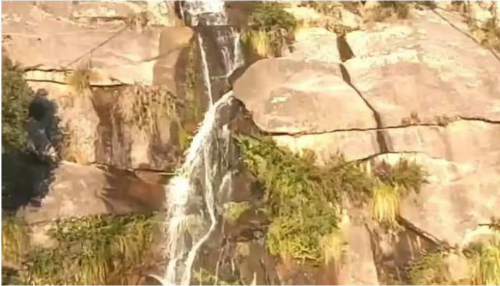
Los condores videos