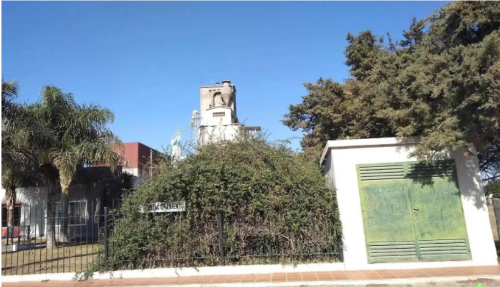
Las juntas como llegar