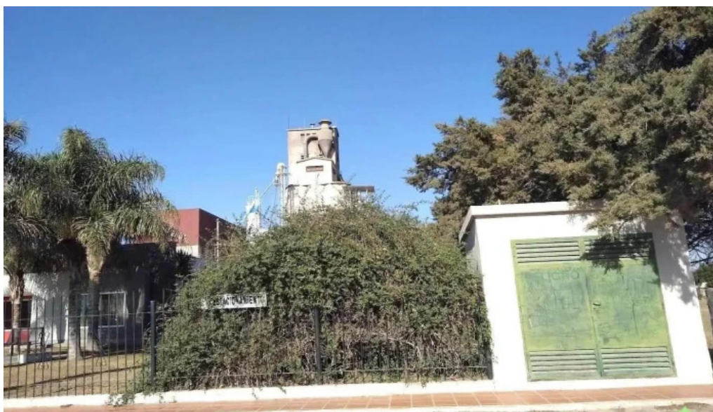
Las juntas las juntas