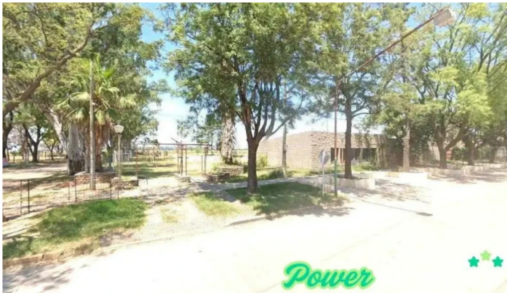
Cooperativa de servicios publicos y sociales la tordilla Ltda la tordilla