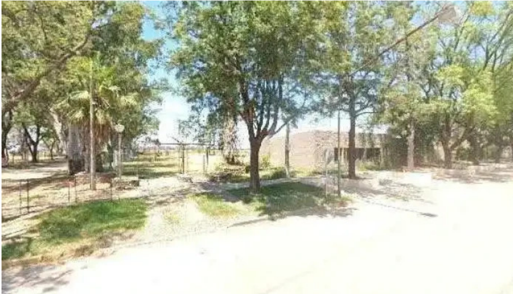
Cooperativa de servicios publicos y sociales la tordilla ltda horario