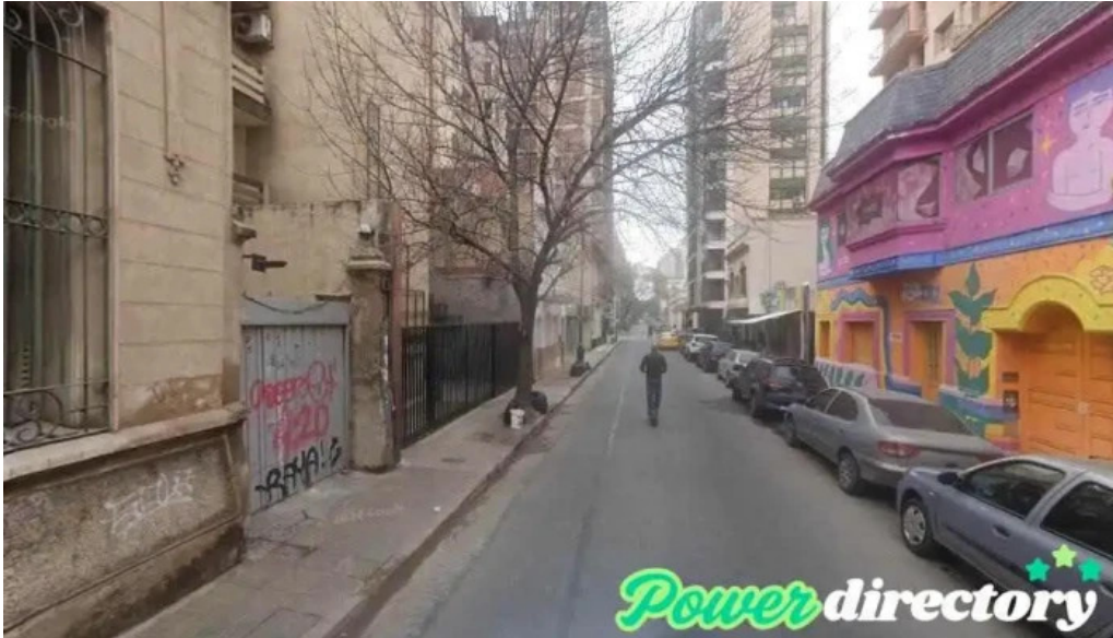
Futuro – banco de tiempo cordoba