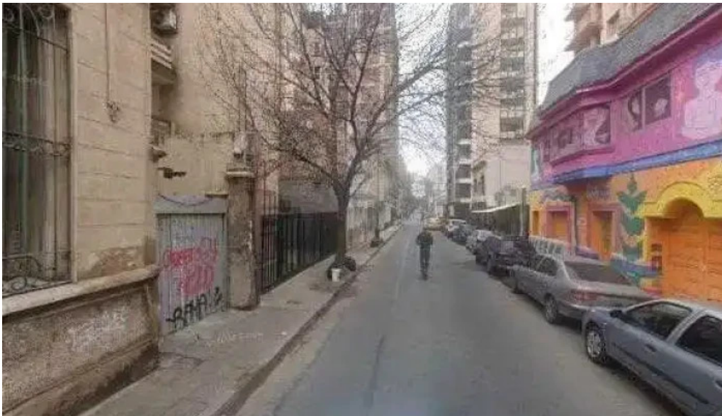
Futuro banco de tiempo sitio web