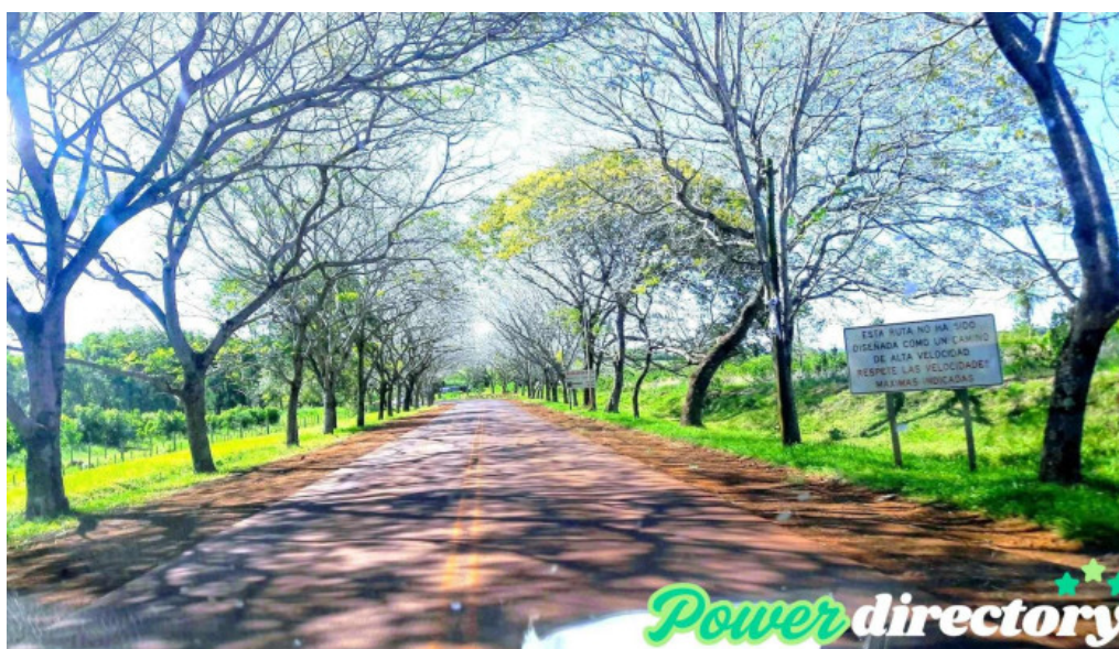
Concepcion de la sierra concepcion de la sierra