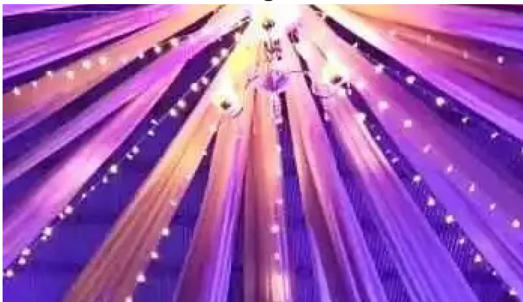
Concepcion de la sierra videos