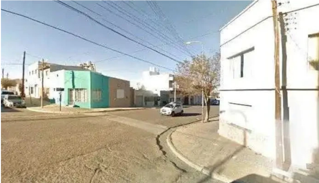
Todo cuotas sa telefono