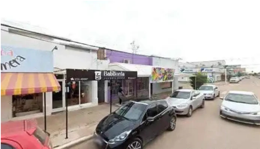
Cooperativa litoral ayuda economica y prestamos puntaje