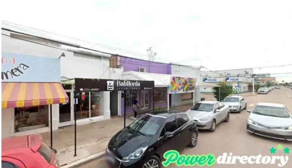
Cooperativa litoral ayuda economica y prestamos charata